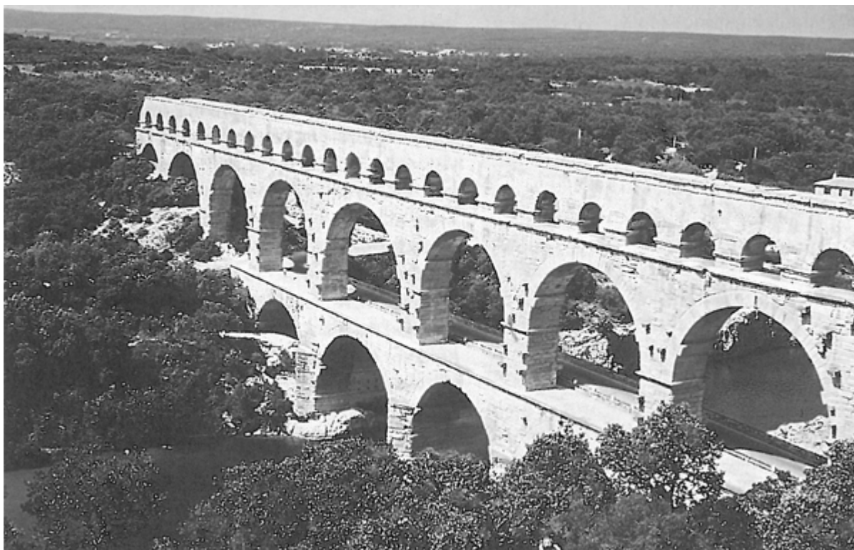
Den såkaldte Pont du Gard, aquaedukten, som førte vand ind til antikkens Nîmes. Her føres ledningen over floden Gard. Vandet løb i den rende, som kan ses helt for oven. Den nedre del har senere tider udvidet en smule, så den kunne fungere som bro.